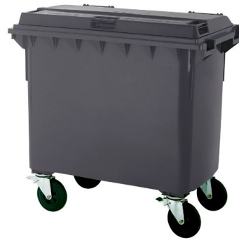
Kuva 6 ja 7. Kannellisia työmaalle soveltuvia keräysastioita ovat esimerkiksi etulastauskontti tai 660 l keräysastia.

Keräysastia sopii erityisesti seuraaville työmaille: