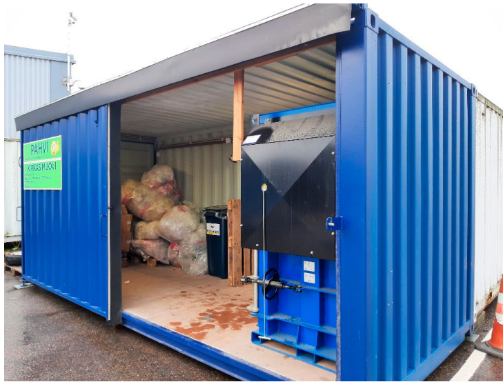
Kuva 4. Jätepaalain voidaan sijoittaa työmaalla esim. konttiin, jonne myös kerätty kalvomuovi ja valmiit paalit voidaan säilöä.

Kalvomuovia on mahdollista paalata tiiviiksi paaleiksi, jotka jätehuoltokumppani noutaa sovitusta paikasta. Kalvomuovin voi kerätä työmaalla esim. säkkeihin, jotka voidaan syöttää paalaimen (kuva 4). Paalaimen käyttö vaatii yleensä koulutuksen laitetoimittajalta. Paalain soveltuu erityisesti infrarakentamisen työmaalle, joissa paalain on mahdollisuus sijoittaa esim. sisätiloihin, katoksen alle tai konttiin. Paalain on kooltaan usein melko pieni, joten se ei vaadi runsaasti tilaa ja soveltuu sen vuoksi myös esim. maanalaisille työmaalle. Syntyville paaleille sekä kerätylle muoville tulee kuitenkin varata tilaa.