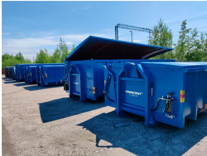
Kuva 5. Kannellinen jätelava soveltuu työmaalle, joissa ei ole mahdollisuutta saada verkkovirtaa.

Jätelavoihin on mahdollisuus hankkia lukitus. Jätelavoja on lisäksi mahdollisuus saada useammalla väliseinällä, jolloin lavaan voidaan kerätä useampaa jätettä samanaikaisesti esim. kalvomuvia ja pahvia.