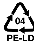
Kuva 2. Kalvomuoveissa käytetty pakkausmerkintä on tavallisimmin PE-LD.

Kalvomuoveja syntyy työmaan kaikissa vaiheissa. Koska jokainen työmaa on omanlaisensa, on yksilöllistä jätehuoltosuunnitelmaa tehtäessä tärkeää miettiä etukäteen työvaiheet, joissa muovijättejakeita, kuten kalvomuoveja syntyy. Muovien erilliskeräys kannattaa aloittaa työvaiheissa, joissa tunnistetaan syntyvän merkittäviä määriä kalvomuoveja. Kalvomuoveja syntyy erityisesti työvaiheissa, joissa käytetään paljon esimerkiksi eristeitä, suodatinkankaita, puutavaraa sekä erilaisia kalusteita ja laitteita. Infratyömaiden viimeistelyvaiheessa eli vaiheissa, joissa asennetaan esim. kalusteita ja erilaisia ulkotilojen välineitä sekä tehdään istutuksia, kalvomuoveja syntyy yleisesti enemmän kuin muissa maanrakentamisen työvaiheissa. Jätehuoltokumppanin kanssa on hyvä käydä keskustelua kalvomuovien syntypaikkojen tunnistamiseksi jo heti jätehuoltosuunnitelmaa tehtäessä tai viimeistään työmaan aloituksen yhteydessä.