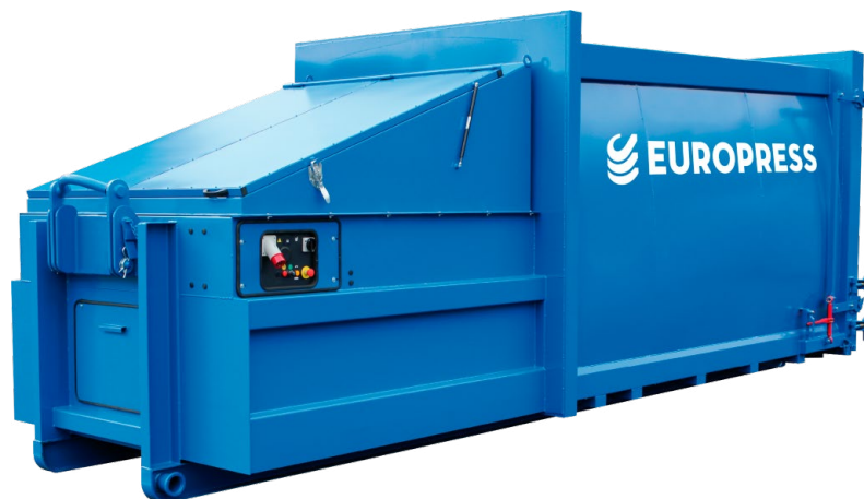
Kuva 3. Puristin soveltuu erityisesti työmaille, joissa tunnustetaan syntyvän paljon kalvomuoveja.

Jätepuristimia on saatavilla myös useampi kammioisina (kaksikammioiset puristimet), jolloin samaan laitteeseen voidaan kerätä esimerkiksi sekä kalvomuovi- että pahvijätettä (kuva 3). Uusimmissa monikammioipuristimissa on liikkuva väliseinä, joka mahdollistaa molempien säiliöiden täyteen keräämisen ennen puristimen tyhjentämistä.